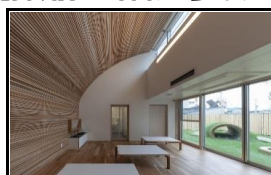
わっしょい保育園(企業内託児所)

私達、菱岡工業株式会社は主に業務用エアコンの制御部の製造をしています。目にしたことが無いという人がほとんどだと思いますが、何もわからなくても大丈夫です。ご興味を持たれたら、是非、会社見学に足を運んでください。本日は、たくさんの方とお会いできることを楽しみにしています。